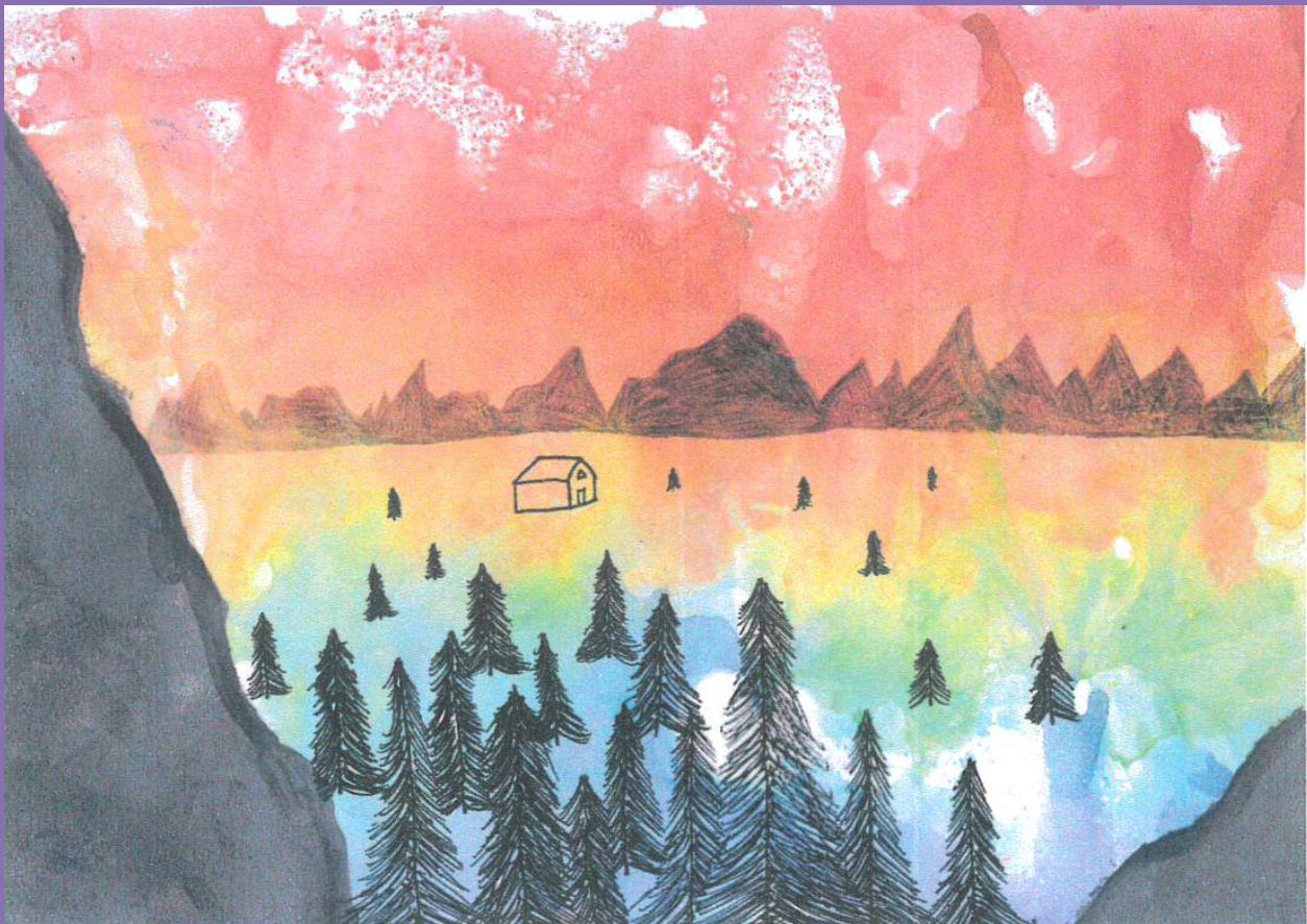
Sophia, 12 Jahre