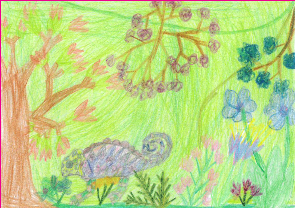
Hella, 10 Jahre