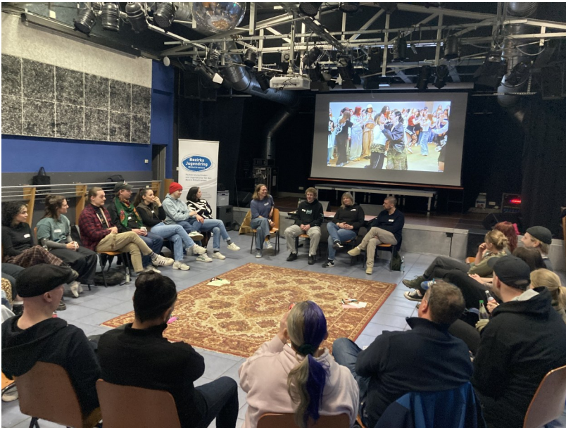
7. Netzwerktreffen Jugendkulturarbeit in Mittelfranken zum Thema „Fan- und Subkulturen... und was wir in die Jugendkulturarbeit mitnehmen können“ in der LUISE in Nürnberg