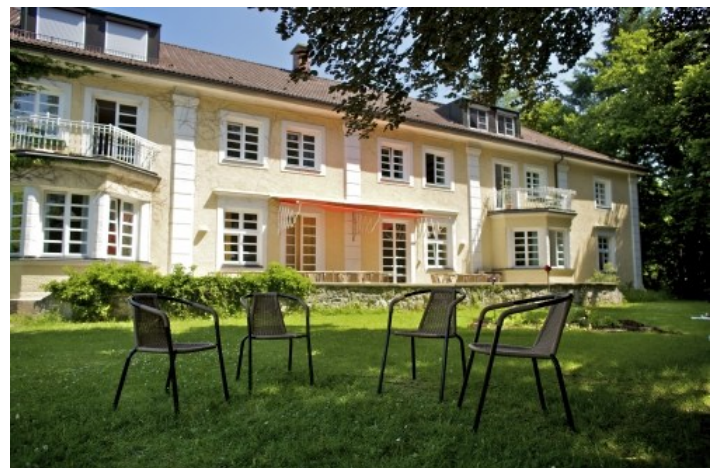
Ansichten des Instituts für Jugendarbeit in Gauting – die alte Villa mit Eingangsbereich und Garten.