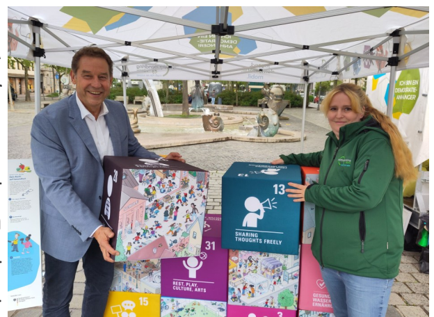
Vorstellung der Kinderrechte- Puzzlewand

Das jugend.demokratie.mobil ist bei „Fürth feiert Vielfalt“, dem Weltdrogentag sowie „Fürth im Übermorgen“ mit Mitmachaktionen, Escape-Room und Breakout-Angeboten rund um Demokratie und Sozialpolitik vertreten.