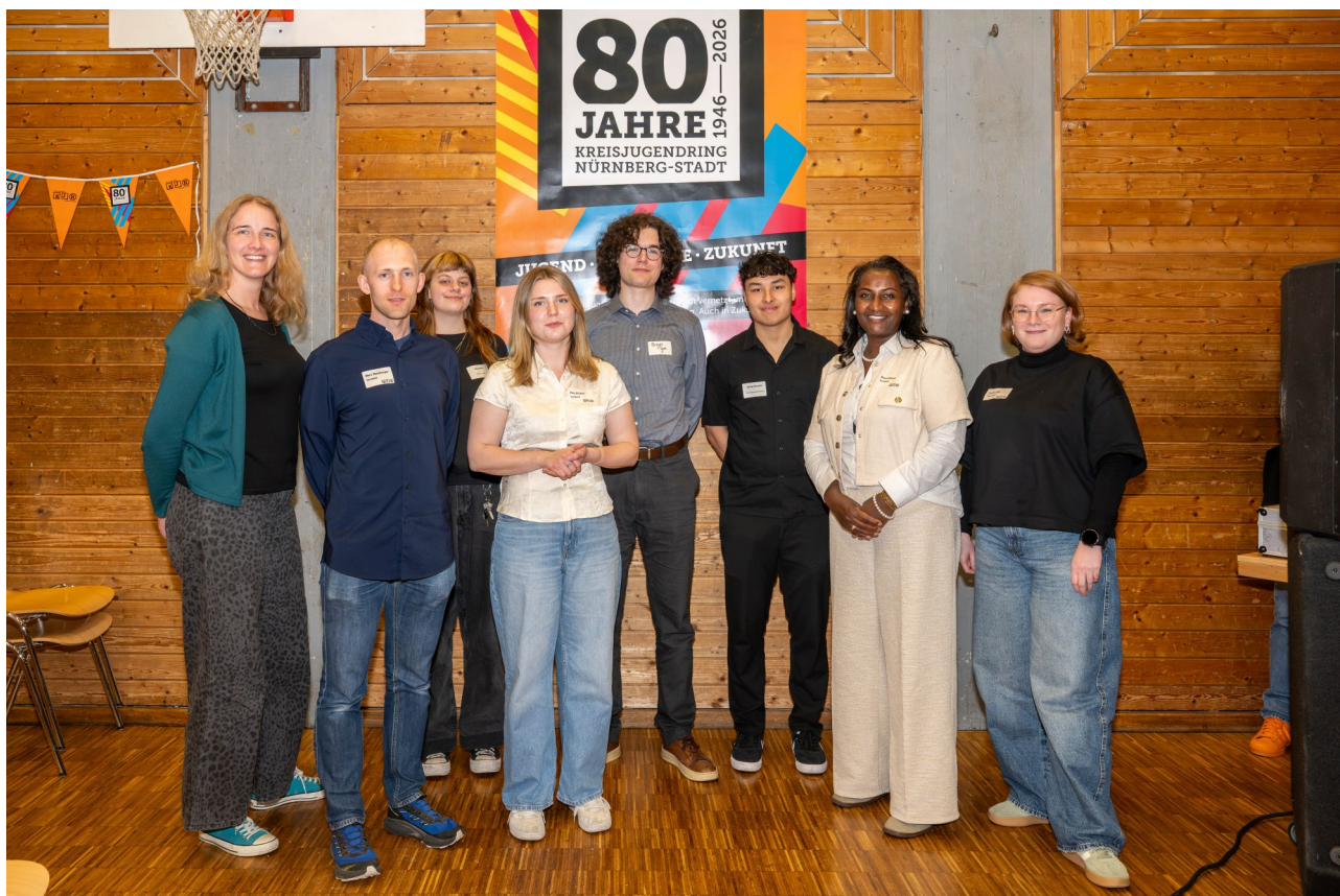
Der neu- bzw. wiedergewählte Vorstand des KJR Nürn-

Der Kreisjugendring Nürnberg-Stadt vertritt aktuell mehr als 60 Jugendverbände und Jugendgemeinschaften und versteht sich als starke Stimme für die Interessen junger Menschen in Nürnberg.