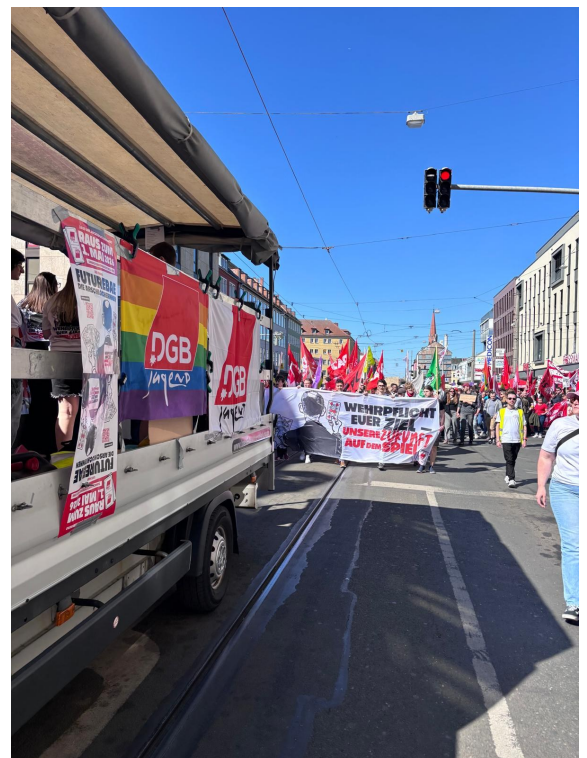
Die DGB Jugend Mittelfranken setzt Zeichen mit ihrer Öffentlichkeitsarbeit