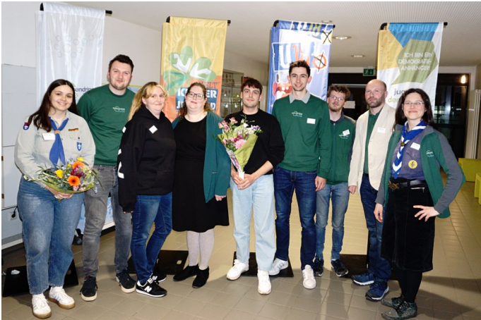
Alter und neuer Vorstand des SJR Fürth