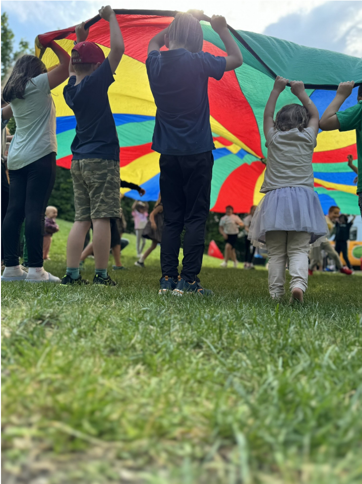
Kinder schwingen einen bunten Fallschirm während andere Kinder unter dem Fallschirm durchrennen.

Die Kinderkundschafter sind erneut im Stadtgebiet Schwabach unterwegs und bringen kreative Aktionen auf verschiedene Spielplätze. Im Mittelpunkt steht das spielerische Erkunden von Gefühlen – mit offenen Angeboten, die Raum für Ausprobieren, Gestalten und gemeinsames Entdecken lassen. Was genau passiert, entwickelt sich vor Ort aus den Ideen der Kinder.