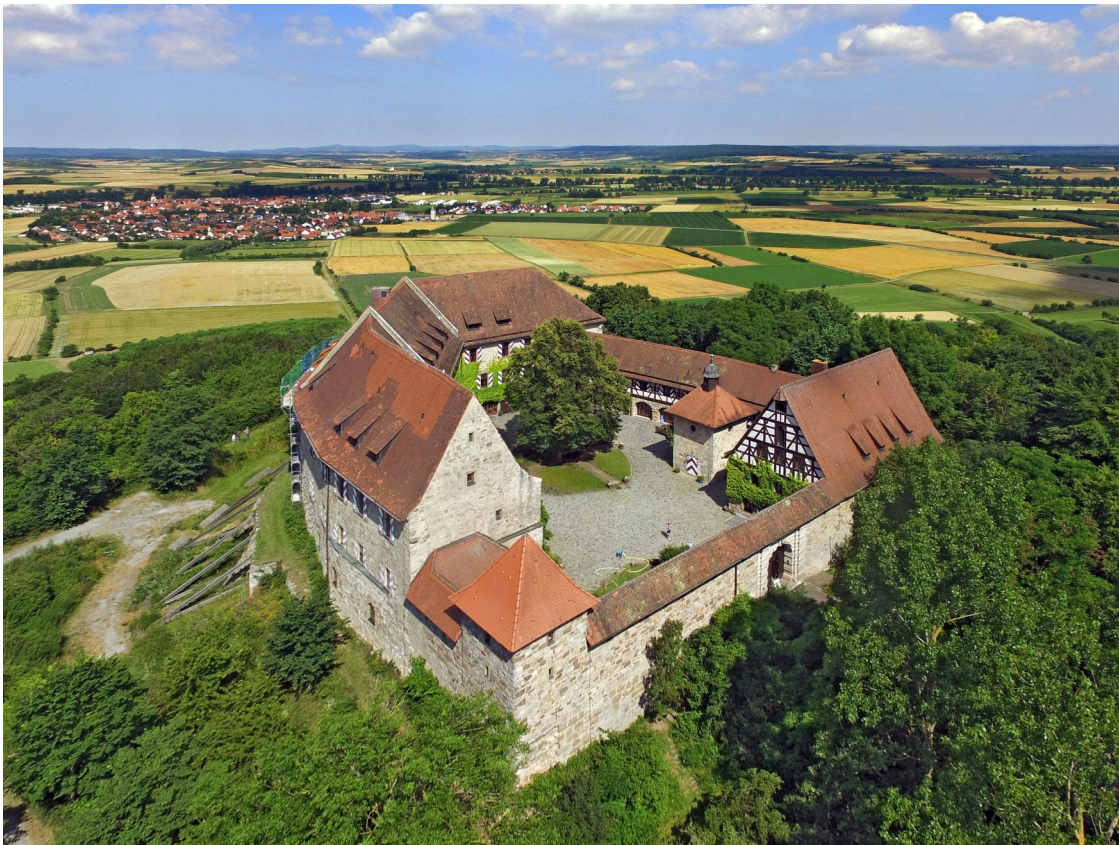
Die Burg Hoheneck

Telefon +49 (9846) 9717-0 oder Mail info@burg-hoheneck.de .