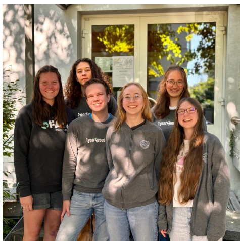
Freiwillige des 1year4jesus Projekts zusammen mit ihrer Teamleitung

Im September startete wieder das FSJ „1year4jesus“. Fünf Freiwillige zogen nach Oberasbach und unterstützen verschiedenste Projekte. Die Woche beginnt mit gemeinsamer Andacht und Feedback. Das Team unterstützt eine Demenz-WG und bringt sich in einer Grundschule sowie in einem allgemeinnützigen Secondhand-Geschäft ein. Sie begeistern die Kinder des Adventkindergartens. Die Wochenenden verbringen die Jugendlichen in Adventgemeinden in ganz Bayern und bringen ihre Talente beim Musizieren, Leiten von