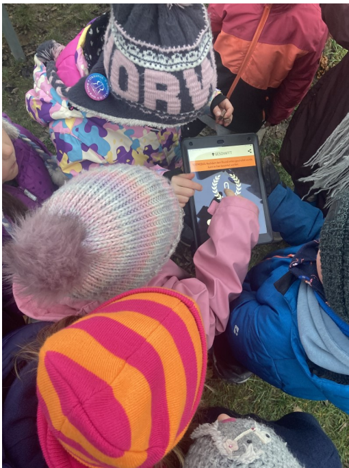
Actionbound SDGs 2024

Im zweiten Jahr der Arbeit unserer staatlich anerkannten Umweltstation Vestenbergsgreuth richtet sich das Gesamtprogramm des Kreisjugendrings Erlangen-Höchstadt bewusst nach den Zielen zur nachhaltigen Entwicklung, der Sustainable Development Goals, kurz SDGs aus. Seit Jahren ist eines der Leitziele unserer Organisation „Fair und ökologisch“, mit dem Jahr 2024 wollen wir aber noch einen Schritt weitergehen. Das gesamte Jahresprogramm, aber auch das Handeln in Gremien und in der Geschäftsstelle wird 2024 nach den SDGs ausgerichtet sein.