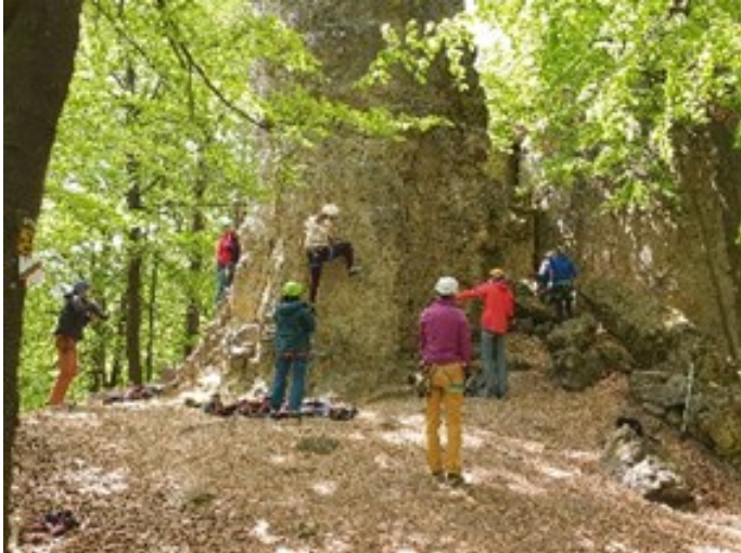
Klettern zu Himmelfahrt