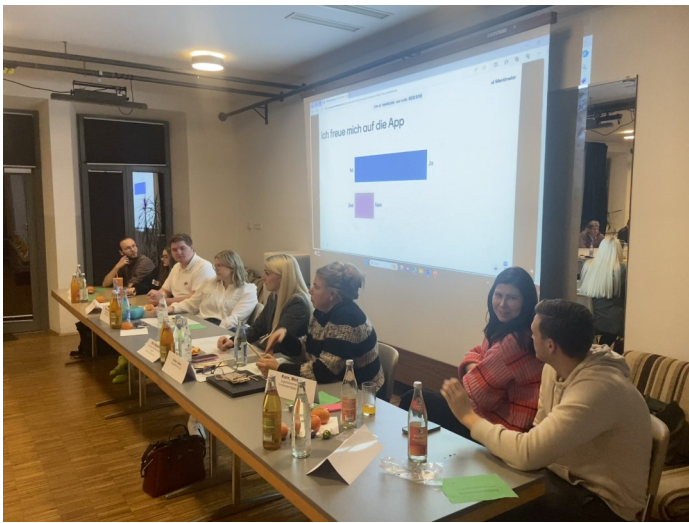
An der Herbstvollversammlung des SJR's war die Jugendapp ein großes Thema

Bei der letzten Herbstvollversammlung des Stadtjugendrings Schwabach wurde die Idee einer JugendApp für Schwabach vorgestellt, die es Jugendlichen und weiteren Nutzer*innen ermöglicht immer top aktuell zu erfahren was gerade an Jugendarbeit geboten ist. In einem kreativen Worldcafé-Format wurde das Vorhaben mit den Vertreter*innen unserer Mitgliedsverbände ausführlich diskutiert. Außerdem wurde festgehalten, was die App